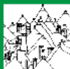
Ordine degli Ingegneri della Provincia di Bari