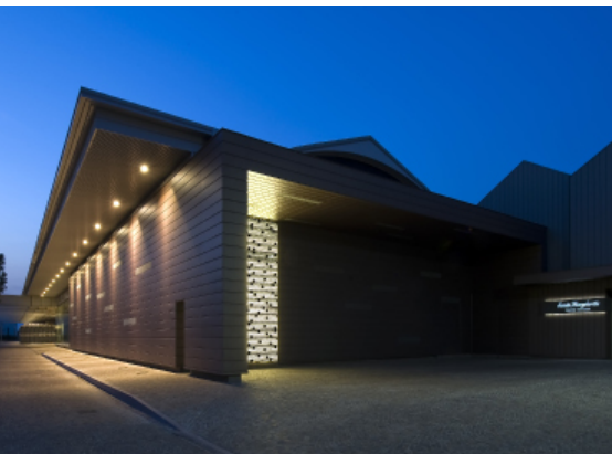
Cantina Santa Margherita, Fossalta di Portogruaro © Moreno Maggi courtesy Westway Architects